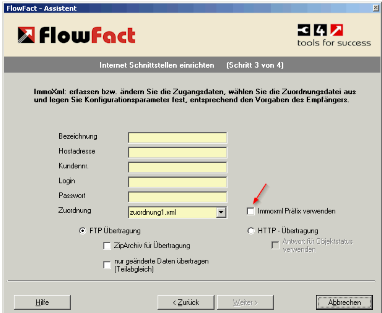
Abbildung aus der Flowfact Hilfe (Stand 08.10.2015)

In einigen Flowfact Programmen gibt es noch weitere Einstellungsmöglichkeiten, unter anderem den sogenannten „OpenImmo Präfix“ oder auch „Immoxml Präfix“. Zur korrekten Übertragung ist es wichtig, dass hier kein Häkchen gesetzt ist.